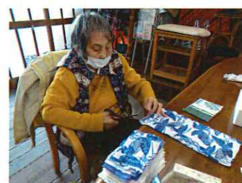
ウエス切りは任せて