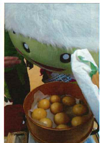
手作りまんじゅうは1時間で完売！！ こだまのおすそわけ市・・・ミニバザー