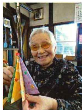
カラフルなクリスマスツリー完成