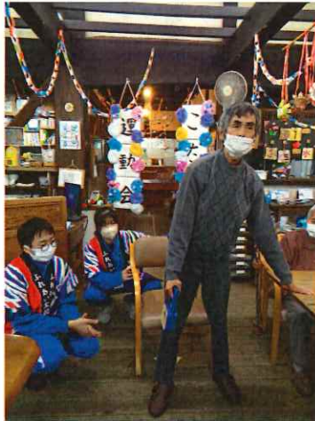
学生さんに、すごいと見せるぞ！