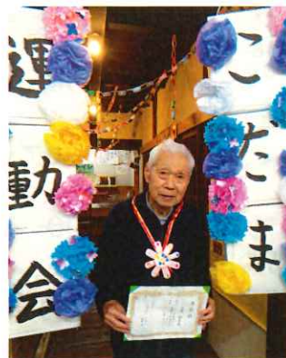
ちょっと照れくさいですが…