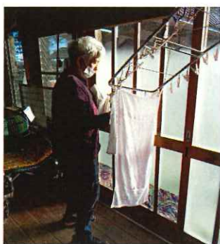
洗濯物干しは生活リハビリ