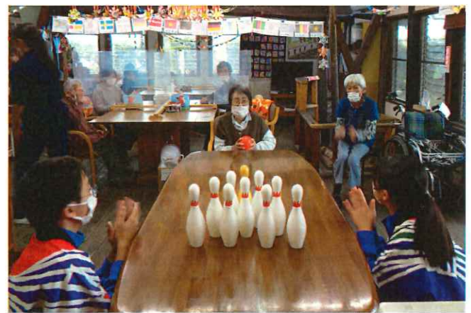
ストライクをねらうわよ！