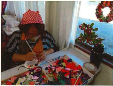
着物布を差し込んだ和風リース作り