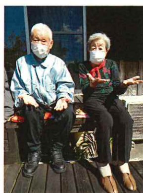
天気のいい日はお外で体操