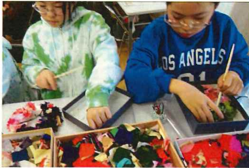
どの色の着物で作ろうかな？