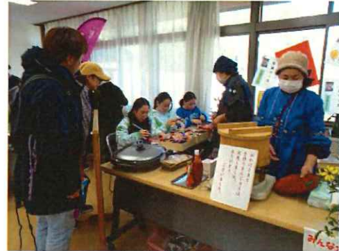
初めて販売したアメリカンドッグは若い方に人気

町政施行40周年記念事業として、睦沢町社会福祉協議会が主催する「第3回 ふくしまルシェ」が12月2日むつざわ福祉交流センターで開催されました。 新型コロナウイルス感染症流行の関係で第2回から間が空きましたが、晴天にも恵まれ大変盛況でした。他福祉事業所の方々と、以前こだままつりで踊ったという方も声をかけてくださいました。 こだまの「デイサービス」で作成した「うみのもり・フラッグ」や日頃取り組んでいる塗り絵も展示しました。こだまの定番おやつ・田舎まんじゅうは、好評につきなんと一時間位で完売。アメリカンドッグは若い方に人気でした。こだまのおすそわけ市から出張したミニバザーコーナーも作りました。家庭でしまい込んであった食器も、お好みの方の手に渡り、喜んでいただけるのではないのでしょうか。引き続き、こだまのおすそわけ市は、こだまの母屋で開催中ですので、お立ち寄り下さい。（4頁に御案内あります） 今回の手作りコーナーは、着物布を発砲スチロールの台に箸で差し込んでいく「和風リース」でした。用意していた材料の台が全てはけ、「私もやりたかった」という声を頂きました。デイサービスでも、片麻痺の方でも箸で差し込むだけなので取り組みました。高齢で指先の力が入りにくい方には少し難しかったのですが、今回参加の皆さんはすてきな仕上げでした。こだまを知って頂く良い機会でした。