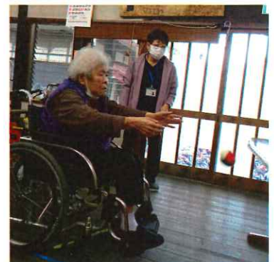
傾聴ボランティアさんと 的当てに挑戦！