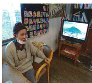
美声が響きわたります