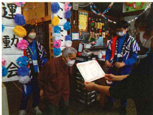
表彰式もかしこまって