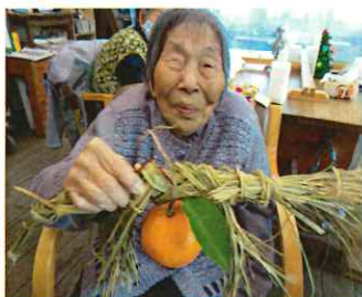
しめ飾り作るのは得意よ